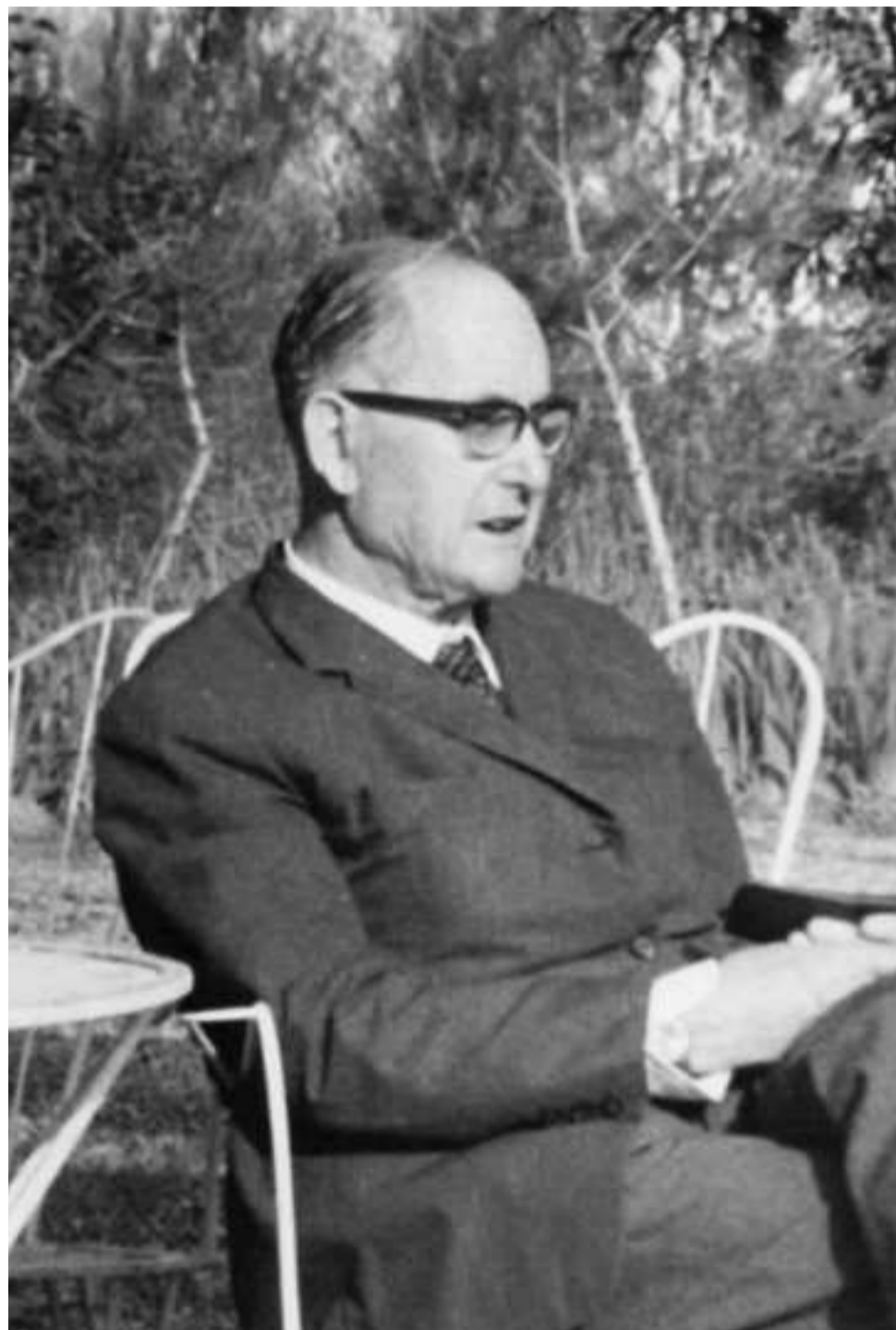
→ Alexandre Deulofeu, un personatge fins ara en l'obscuritat, revisitat pels historiadors.

A Figueres és on va brollar en el tombant de segle tota una generació d'intel·lectuals, al caliu del creixement urbà i d'una societat dinàmica (a la foto, la primera estació de ferrocarril).