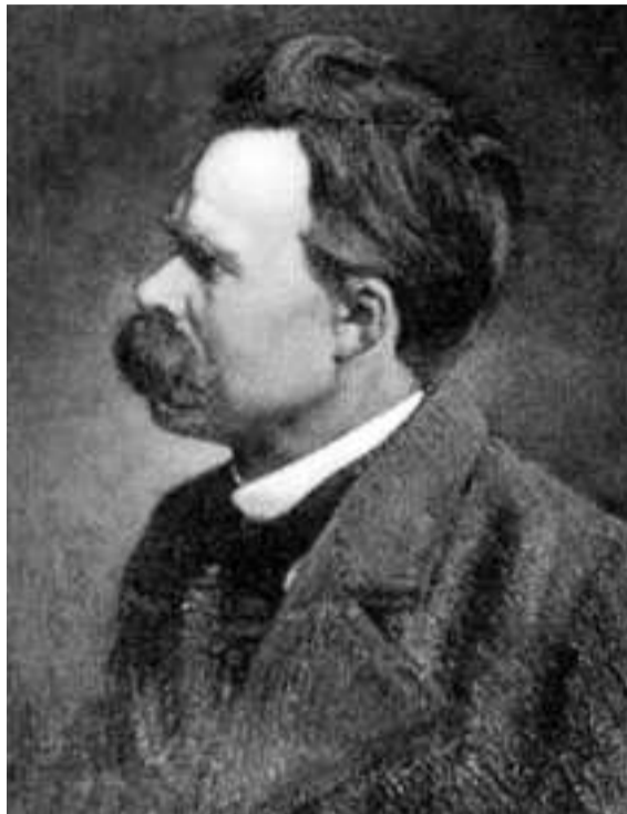
→ Nietzsche ja va parlar d'un "etern retorn".